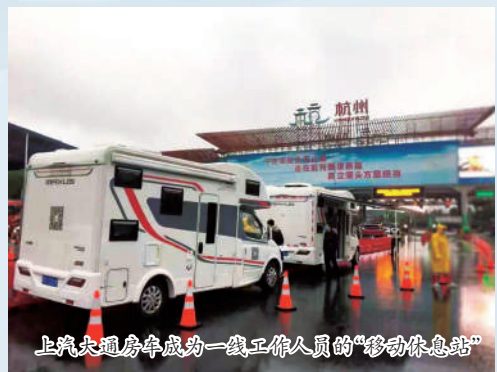
上汽大通房车成为一线工作人员的“移动休息站”

2月7日上午,一辆宽敞明亮、设施完善的房车开到了杭州南收费口,作为一线防疫检查人员的“移动休息站”,为他们提供服务。当日,其它10辆上汽大通房车也分别开到了三墩、转塘、半山、德胜等高速出入