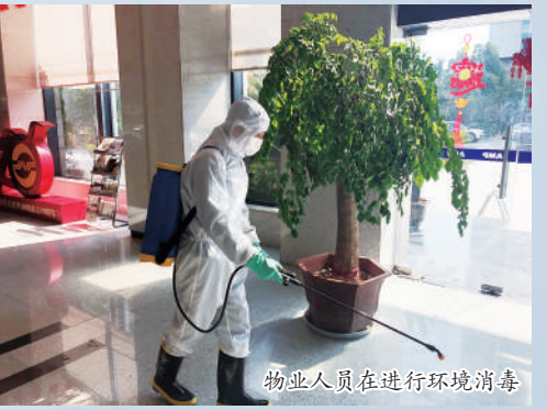
物业人员在进行环境消毒

2月10日,浙农控股集团迎来了节后复工的第一天。为做好防疫工作,集团积极开展各项防控措施,包括全面排查各级企业员工信息,尽量避免安排集中办公、严密组织消毒作业,每日线上健康打卡、暂时关闭B2层进入大厦通道、禁止外卖和快递人员进入大楼、为到岗员工提供盒饭等。集团也作为第一批复工企业接受了杭州电视台西湖明珠频道的《明珠新闻》栏目的采访。